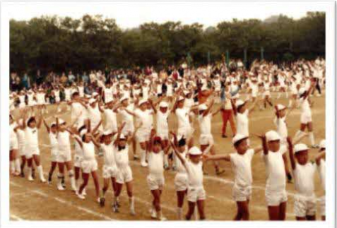
児童数が多かった頃の運動会