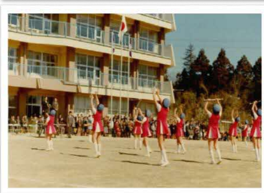
昭和52年 鉄筋校舎落成式 全校児童数 本校分校合計 392名