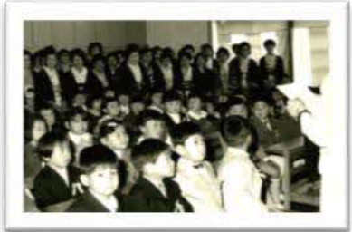
昭和47年度入学式 全校児童数 合計329名