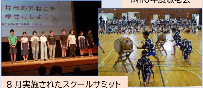
8月実施されたスクールサミット